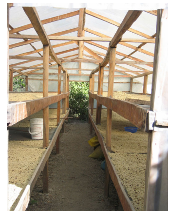
Serre de séchage