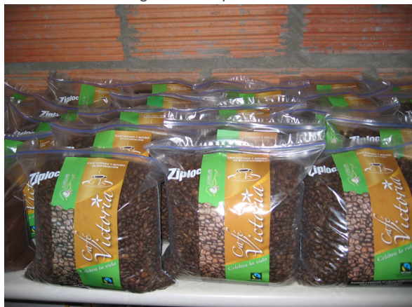
Le café Victoria: un café équitable destiné au marché local